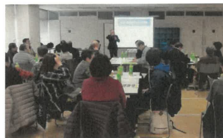
災害ボランティア交流会(30年1月)