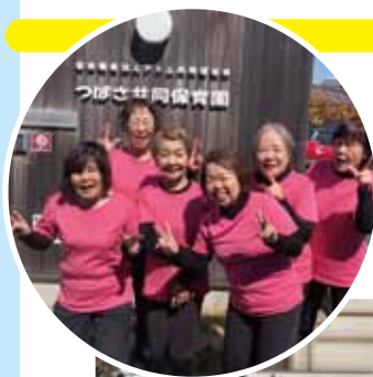
つばさ保育園を訪問しました