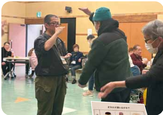
↑ 伝言ゲームは伝えるのに難しいけど楽しかった♪