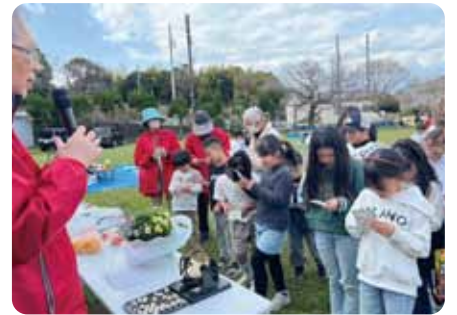
お花見会と新入生お祝い会

春休みでもあり、遠くから里帰りのお客様でお弁当300個、ビンゴ参加者は110余名賑やかでした。