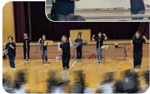
子ども達の発表してくれる姿がとても可愛らしくて、いつも元気をもらいます。