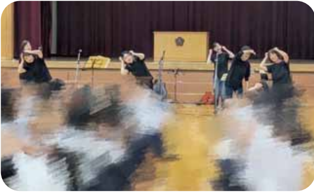
「モグモグモグラ♪」みんなで手話をしました。