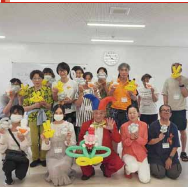
ボランティア入門講座(バルーンアート)