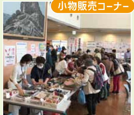
小物販売コーナー