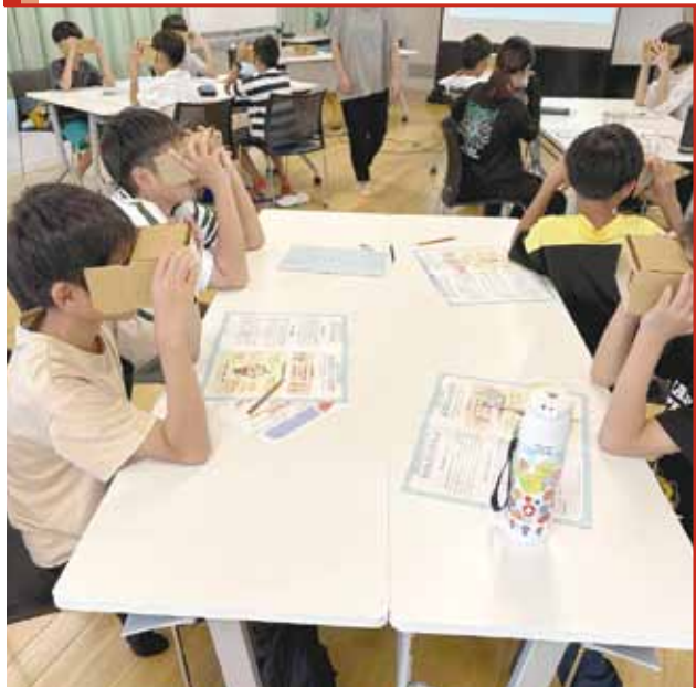
児童体験講座（認知症フレンドリーキッズ授業）