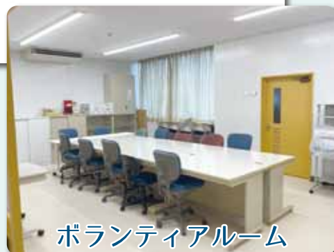
ボランティアルーム