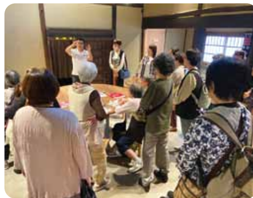
酒蔵の見学にも行きました