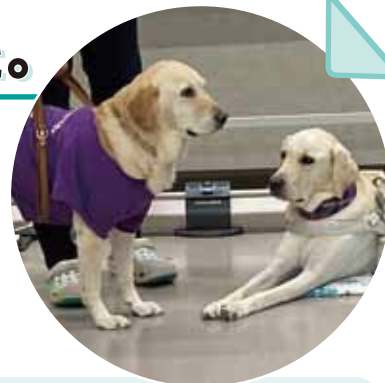
2匹の盲導犬とても可愛かった