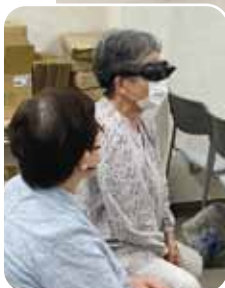
視覚障がい者の体験をしました