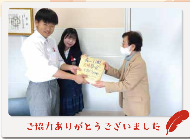
ご協力ありがとうございました