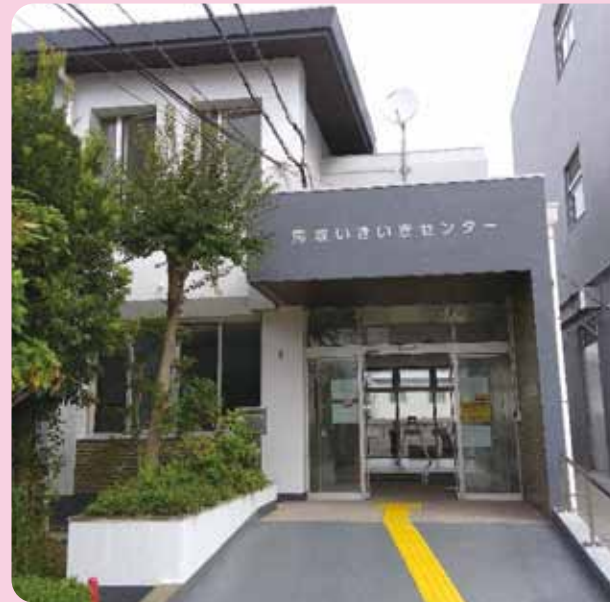
地域共生社会の活動拠点となります。