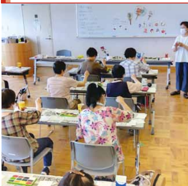
ボランティア入門講座(絵手紙講座)