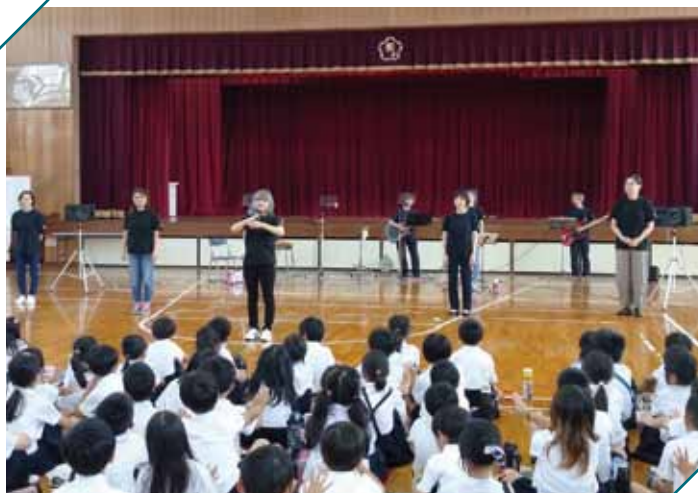
西小学校2年生のようす

出前手話講座は「シュワ'K」結成当初からの主な活動の1つです。子ども達の興味深々な眼差しと一緒に手を動かす姿。