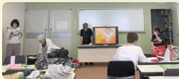
「おこんじょうるり」練習風景 12月15日(日) 生涯学習センターで