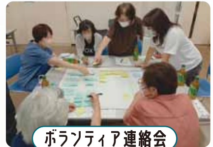
ボランティア連絡会