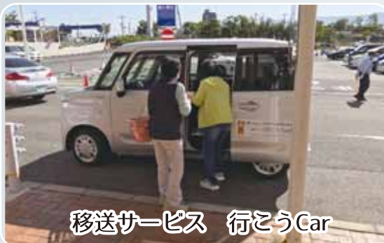
移送サービス 行こうCar