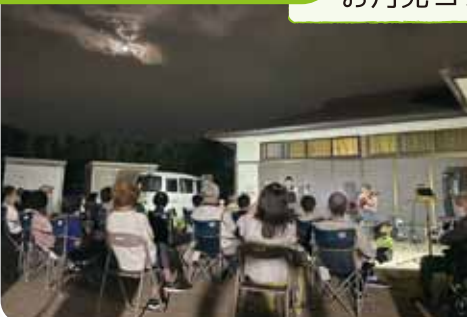
お月見コンサート