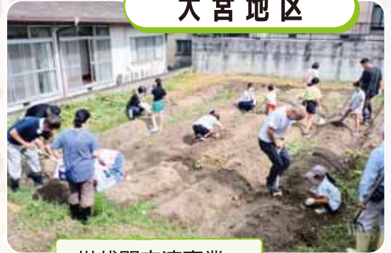
世代間交流事業 さつまいも掘り