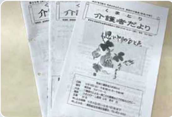
社協だより・介護者だよりの発行