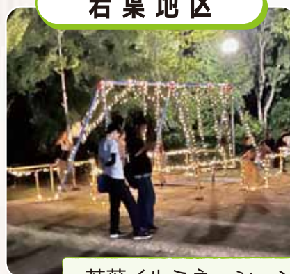
若葉イルミネーション